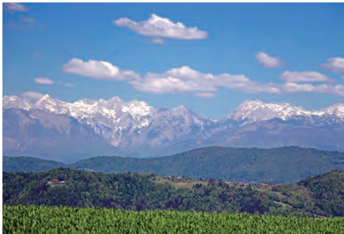
Pogled na Grintovce z Obolnega (776 m) v zahodnem delu Posavskega hribovja na praznični 1. maj. Snega na sicer prisojnih pobočjih je bilo le še za vzorec. Je pred nami spet sušno poletje?