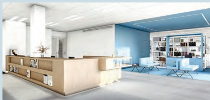
Prikaz notranjosti Knjižnice Franceta Balantiča Kamnik.