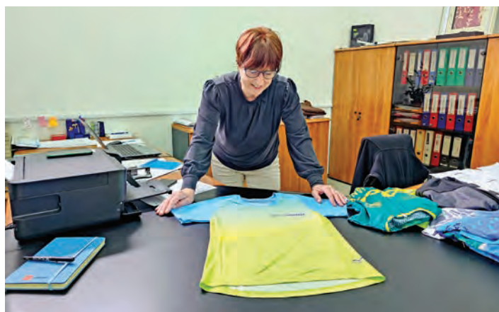
V podjetju Active Stitches iz Dragomlja izdelujejo športna oblačila po meri za različne športe.

Čeprav podjetje deluje večinoma na slovenskem trgu, imajo stranke tudi v tujini – zaenkrat v Franciji, Avstriji in na Hrvaškem. Ostajajo butični, masovna proizvodnja jih ne zanima. Za še večjo prilagodljivost in hitrost si želijo tridimenzionalne projekcije za izdelavo krojev.