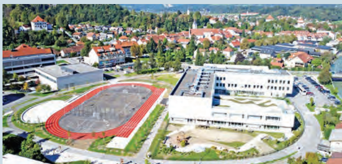
Nova OŠ Frana Albrehta in športno-rekreacijski park med šolama.

Občina Kamnik je prostor izjemnih naravnih danosti in bogate kulturne dediščine, a njeno pravo srce utripa v ljudeh – v občankah in občanih, ki vsakodnevno soustvarjajo življenje naše skupnosti. Razvoj Kamnika načrtujemo premišljeno in odgovorno – s spoštovanjem do naše skupnosti in bogate dediščine ter z jasno vizijo prihodnosti za naslednje generacije. V zadnjih treh letih je Občina Kamnik uspešno pridobila več kot 8 milijonov evrov evropskih in državnih nepovratnih sredstev ter zagnala razvojne projekte v skupni vrednosti več kot 15 milijonov evrov. To pomeni nove ceste, urejeno infrastrukturo, kakovostnejše javne površine in boljše pogoje za življenje vseh generacij. Brez premišljenega načrtovanja in aktivnega pridobivanja zunanjih virov financiranja številnih teh projektov zgolj z občinskim proračunom ne bi mogli uresničiti.