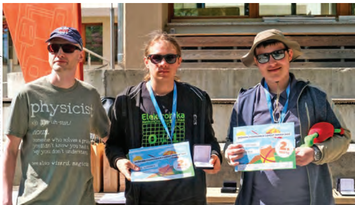
Drugo mesto je zasedla ekipa PŠ Ihan.

Petnajst ekip s slovenskih osnovnih in srednjih šol je na vadišču Slovenske vojske Poček pri Postojni v praksi preizkusilo svoje mini satelite in druge rešitve, ki so jih razvijali vse šolsko leto. Naloga ekip je bila izdelati satelit v velikosti pločevinke brezalkoholne pijače, ki je moral preživeti izstrelitev, s pomočjo vgrajenih senzorjev zbirati predpisane podatke in varno pristati. Ekipa so morale same zasnovati satelit, izbrati senzorje in pripraviti programsko opremo. Vse komponente so morale biti dovolj majhne, da so se prilegale v ohišje satelita.