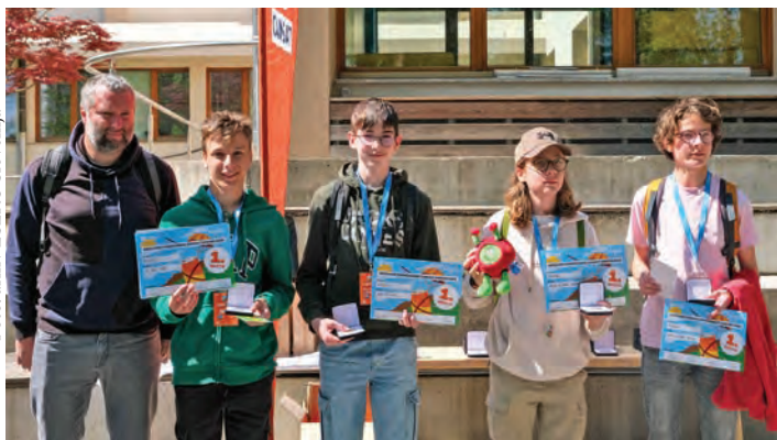
Zmagovalna ekipa OŠ Rodica.

Domžale, Postojna – Aprila je v Postojni potekalo državno inženirsko-vesoljsko tekmovanje CanSat 2026 za osnovne in srednje šole, na katerem udeleženci zasnujejo, izdelajo in preizkusijo simulacijo satelita v velikosti pločevinke brezalkoholne pijače. V kategoriji osnovnih šol je zmagala ekipa RodiSAT z Osnovne šole Rodica, drugo mesto je zasedla Leteča pločevinka s Podružnične šole Ihan.